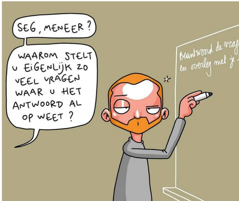
Cartoon van Arnoleon.